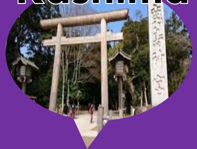
Kashima Shrine Omachi Street 鹿島神宮大町通り