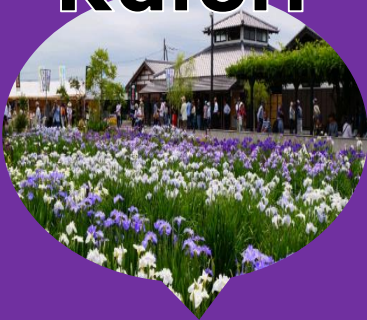
Suigo Sawara Iris Park 水郷佐原あやめパーク