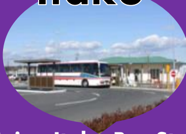
Suigo Itako Bus Station 水郷潮来バスターミナル